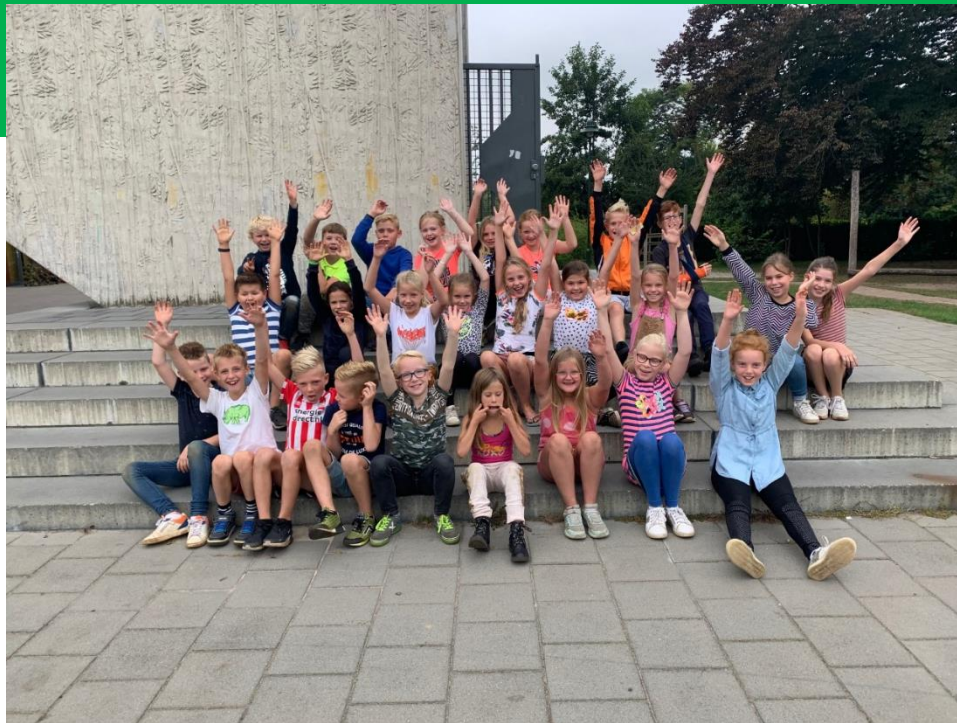
Dit zijn (bijna) alle kinderen uit groep 5-6