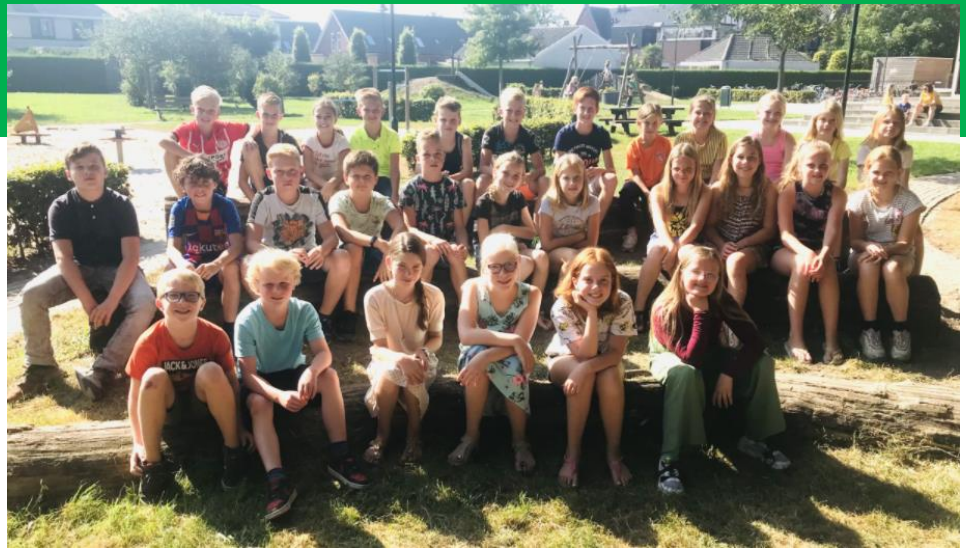
Dit zijn alle kinderen in groep 6-7